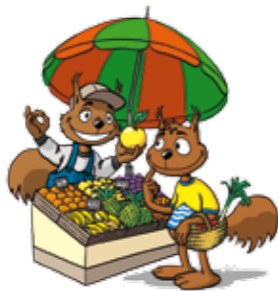
Wochenmarkt Eckernförde* *Frische Qualität aus unserer Region