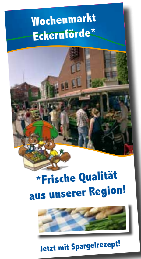
Neuer saisonaler Wochenmarktflyer

Im April und Mai erwarten Sie zudem noch weitere Themenveranstaltungen. Die Musicalfans von heute und die Musicalstars von morgen sind bei den Eckernförder Musicaltagen richtig aufgehoben. Krimifans sollten sich die Eckernförder Krimitage notieren. Die Daten finden Sie in der Tabelle links. Fragen zu diesen und allen anderen Veranstaltungen können Sie an uns richten: Tel. 04351-71790, Mail: info@ostseebad-eckernfoerde.de