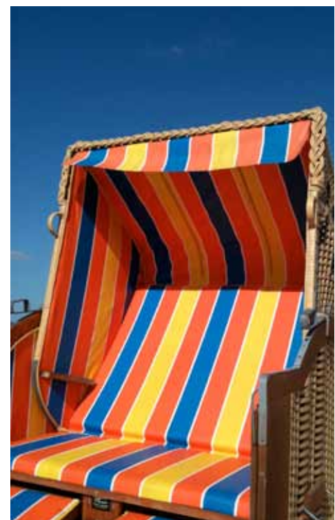
Strandkörbe: zurzeit sehr beliebt

Wir dürfen uns schon seit einigen Tagen und Wochen über das tolle Wetter freuen. Dies führt zu vielen Besuchern der Eckernförder Strandabschnitte. Wer einen Strandkorb in diesen Tagen mieten möchte, der sollte möglichst zeitig bei der Tourist-Information erscheinen.